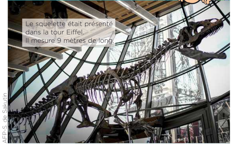
Le squelette était présenté dans la tour Eiffel. Il mesure 9 mètres de long.